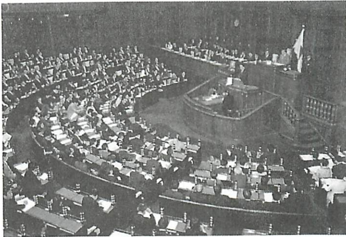
◆美國媒體報道中國威脅論，為早已下定決心，在國會通過解禁集體防衛權法案的日本安倍政府提供助力。

會審議也是於5月26日開始的，在日本國民多數不贊成的情況下，安倍政府已下定決心通過並實行集體防衛權，而此時通過美國媒體報道的中國威脅論，對日本政府強硬推行的法案審議也可說是一大助力。筆者甚至認為美日防衛當局有可能進行過磋商，協助炒作中國威脅論為TPA和集體自衛權法案在各自的國會通過造勢。