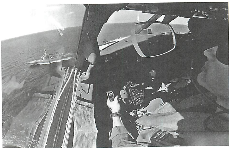
◆2015年5月一部美國偵察機前往中國南海島礁上空，被中國海軍發現並警告。

一、20日CNN登機採訪，21日電視播出，而22日即美國國會參議院投票表決通過TPA法案，如此準確掌